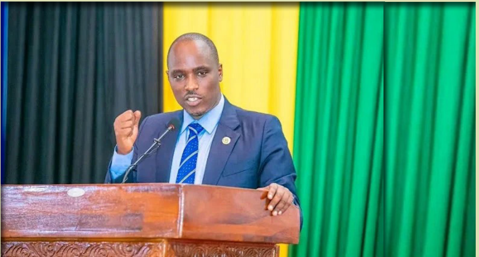
Naibu Waziri Mkuu na Waziri wa Nishati Mhe. Dkt. Doto Biteko (Mb) akiongea wakati wa Kongamano la Kumbukizi ya miaka 40 ya Hayati Edward Moringe Sokoine lililofanyika katika Ukumbi wa Multipurpose Kampasi ya Edward Moringe, Morogoro.