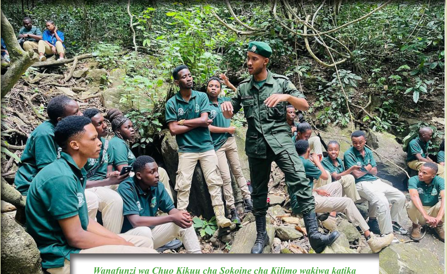
Wanafunzi wa Chuo Kikuu cha Sokoine cha Kilimo wakiwa katika Hifadhi ya Taifa ya Mlima Udzungwa kwa ajili ya mafunzo kwa vitendo.